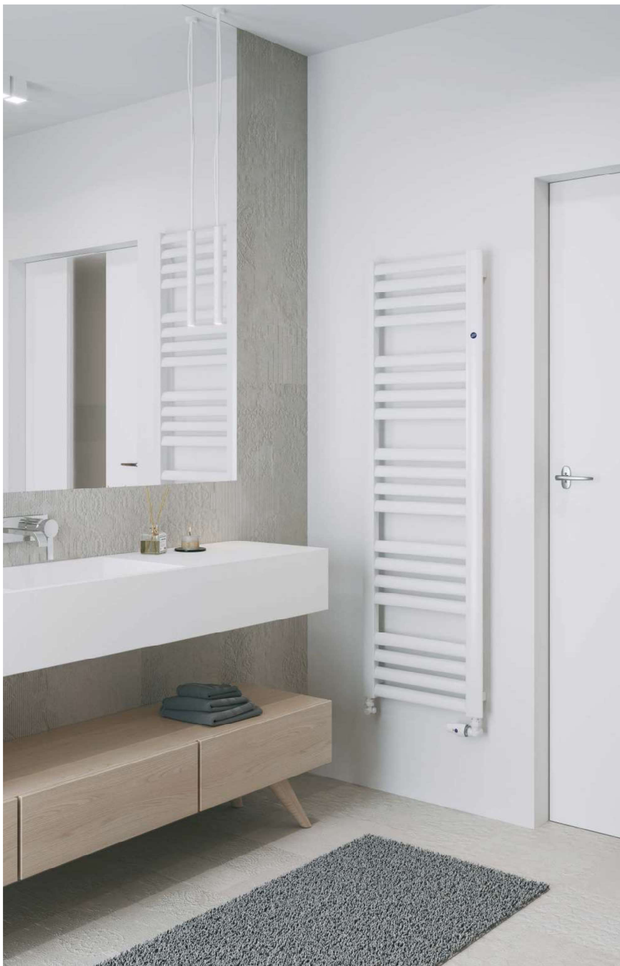
Na aranżacji: grzejnik c.o. MAK-50/160, zestaw zaworowy Z14 In the visualisation: MAK-50/160 heating radiator and Z14 valve set