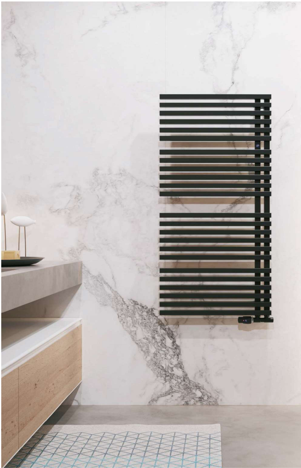
Na aranżacji: grzejnik c.o. GLT-60/120C31, zestaw zaworowy Z15 In the visualisation: GLT-60/120C31 heating radiator and Z15 valve set